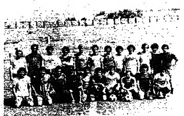
صورة جامعة فريق الانصار في تيرين له في رومانيا